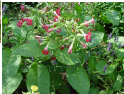
Sůrašosa - NICOTIANA TABACUM L. - tabák obecný Severní Amerika